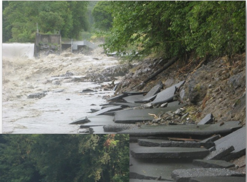
Le chemin du Chèze