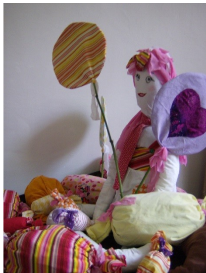
Les arts créatifs et la couture