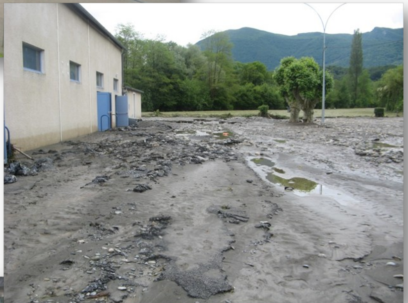
La salle des fêtes