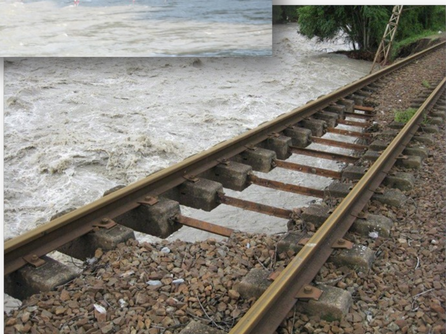
La voie ferrée à Coarraze