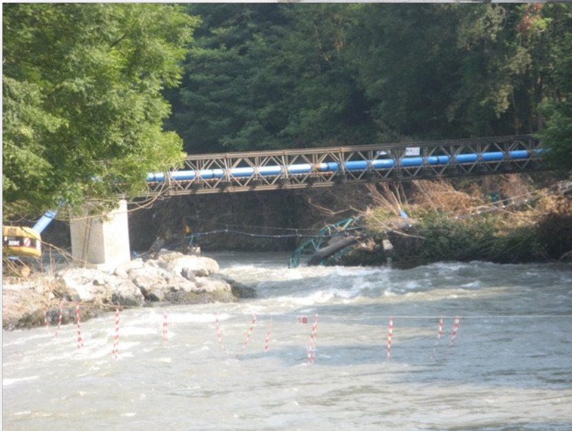
La nouvelle passerelle d'alimentation d'eau