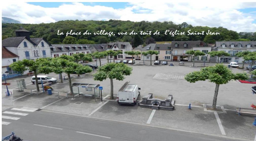
La place du village, vue du toit de l'église Saint Jean