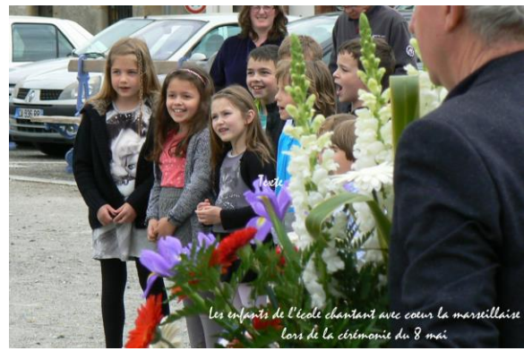
Les enfants de l'école chantant avec cœur la marseillaise lors de la cérémonie du 8 mai