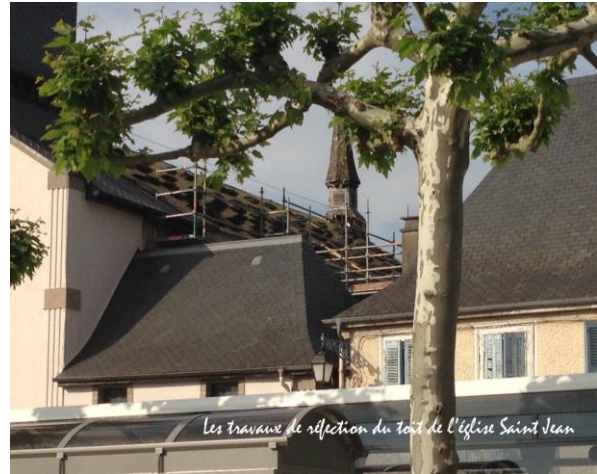
Les travaux de réflexion du toit de l'église Saint Jean