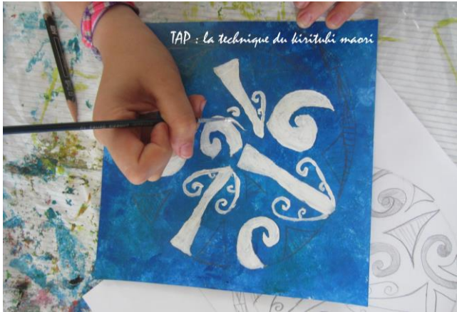
TAP : la technique du kirituhi maori