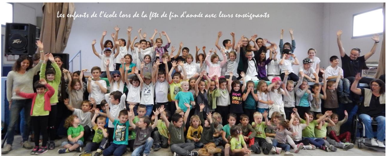
Les enfants de l'école lors de la fête de fin d'année avec leurs enseignants