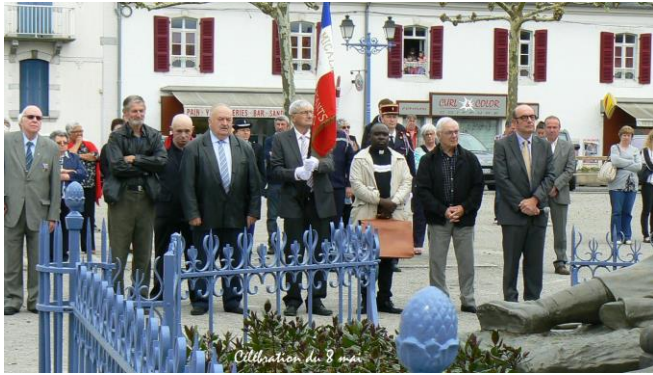
Célébration du 8 mai