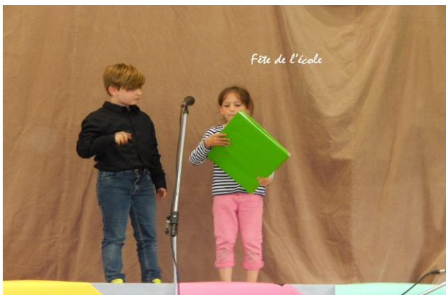
Fête de l'école