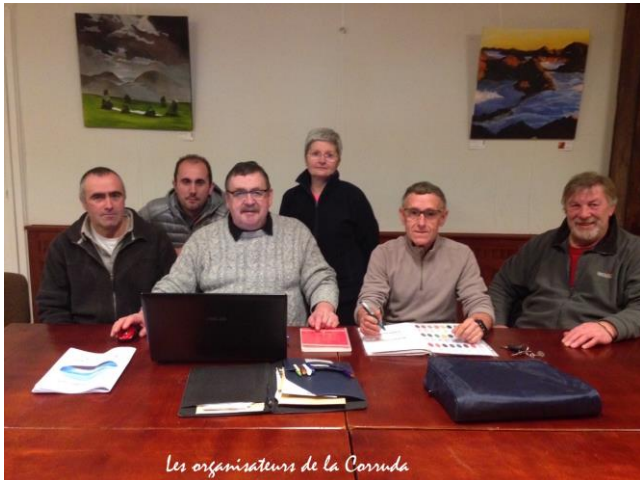
Les organisateurs de la Corruada