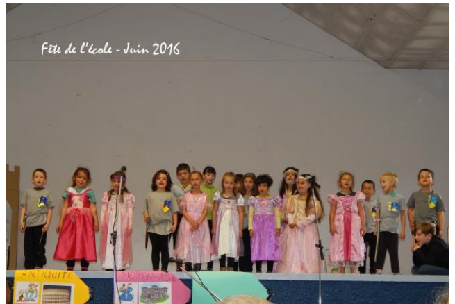
Fête de l'école - Juin 2016