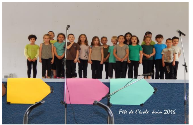
Fête de l'école Juin 2016