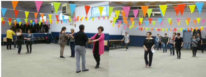
Stage de rock