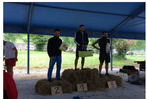
les vainqueur(e)s des trails et l'équipe des chronomètres