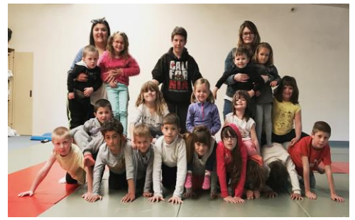
Les activités du Centre de loisirs Pinocchio